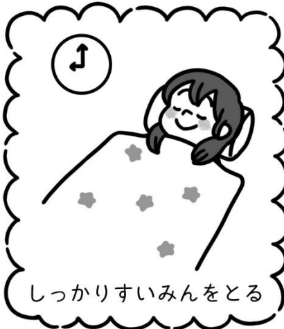
しっかりすいみんをとる